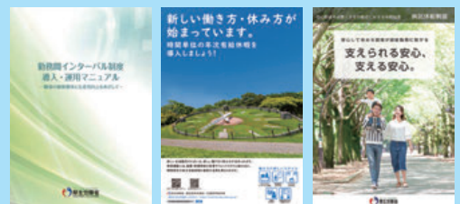
各制度に関するリーフレット（例）

「勤務間インターバル制度」「時間単位の年次有給休暇制度」「特別な休暇制度」などについて、企業の取組事例の紹介や、リーフレットなどの資料を掲載しています。自社における制度検討の参考にご活用ください。